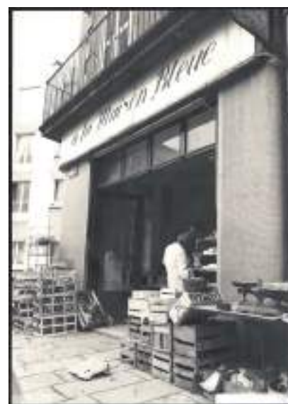
La Maison Bleue. Mado Le Gall (1981). Collection archives de Brest

achalandé, les cageots débordaient jusque sur le trottoir rue Danton et les files d'attente y étaient impressionnantes.