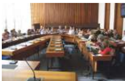
La salle du conseil municipal mobilisée pour la rencontre des CCQ de Brest et de Rennes-Sud gare

Lundi 28 mars, une délégation d'un conseil de quartier de Rennes est venue nous rendre visite avec son élue et des membres de leur direction de quartier (l'équivalent de notre direction de la proximité). La journée nous a permis de faire connaissance. Comment cela se passe-t-il ailleurs ?