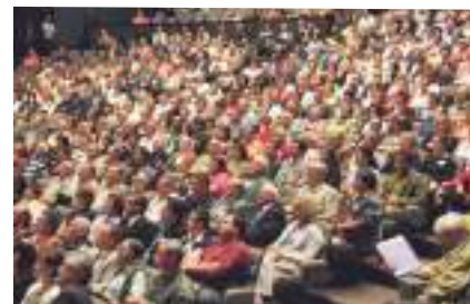
Accueil des 750 membres des CCQ de Brest en 2008

l'édition de cette lettre et l'hébergement du site internet. Pour l'animation dans les quartiers, le CCQ peut demander l'aide des services municipaux et des structures de quartier (patronage, bibliothèques...).